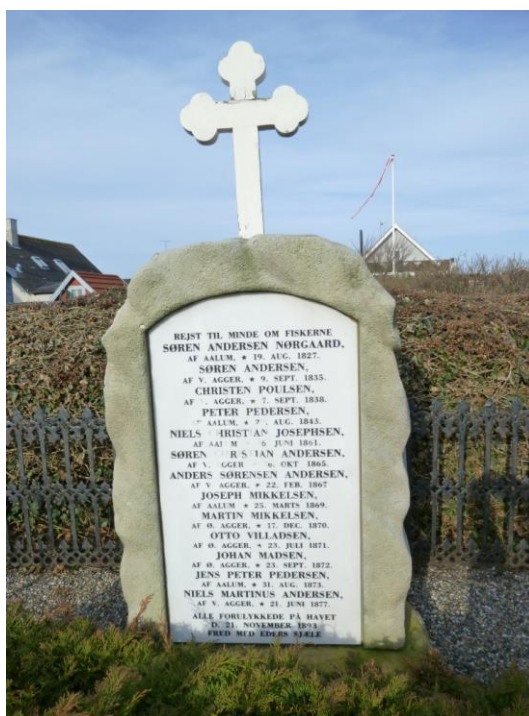
Gravstenen over de 13 druknede, i november 1893.

Ulykken fik stor betydning de steder hvor den var voldsomst. I Harboøre kom der gang i indremissionske vækkelser, og folk blev splittet mellem "hellige" og vantrø - indremissionske og grundtvigianere.