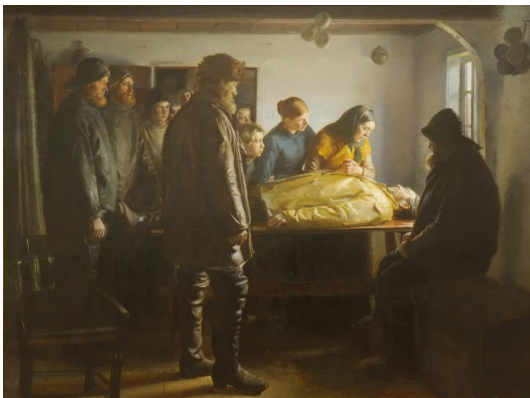
"Den druknede", malet af Michael Ancher i 1896.

I Agger kom der også gang i indremissionske vækkelser efter ulykken, der kostede 13 fiskere livet. Agger kan derfor sagtens sammenlignes med Harboøre.